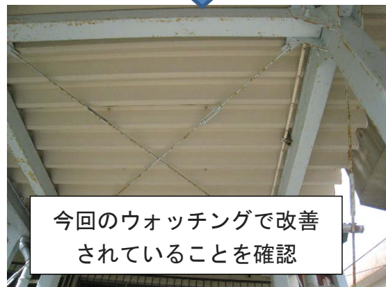
今回のウォッチングで改善されていることを確認