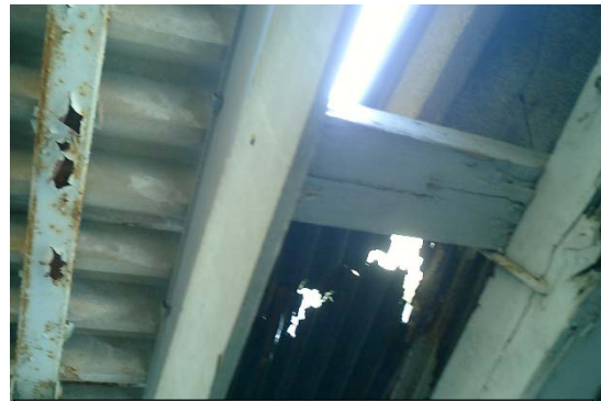
前回のウォッチングでの指摘箇所